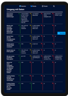
Social Media Matrix ↗