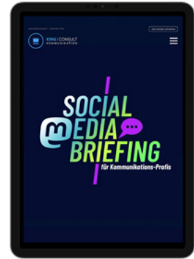
Social Media Briefing ↗