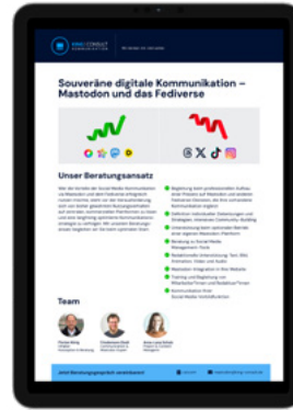
Factsheet souveräne digitale Kommunikation ↗